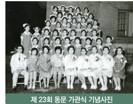
제 23회 동문 가관식 기념사진