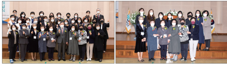
▲ 2021년 개교기념 재상봉 동문 2021.10. 29