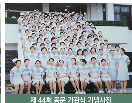
제 44회 동문 가관식 기념사진

매년 개교기념일에는 졸업 45주년 (2020년까지는 졸업 50주년)과 25주년이 되는 동문들의 모교방문과 재상봉이 있습니다. 이 뜻깊은 행사는 1994년, 16회 동문이 졸업25주년을 맞이하여 모교를 방문한 것으로 시작되었습니다. 2021년에는 제23회 동문과 제43회 동문이 모교를 방문하였고, 2022년에는 졸업 45주년이 되는 제24회 동문과 졸업 25주년이 되는 제44회 동문의 모교방문과 재상봉이 있을 예정입니다. 〈편집자주〉