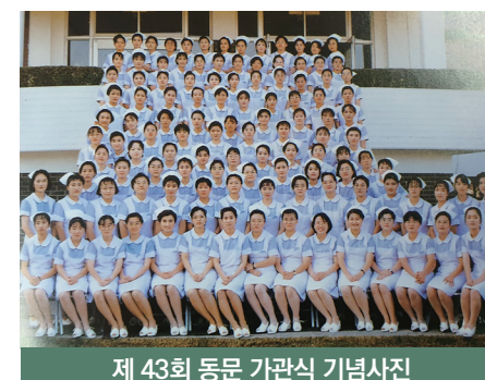
제 43회 동문 가관식 기념사진