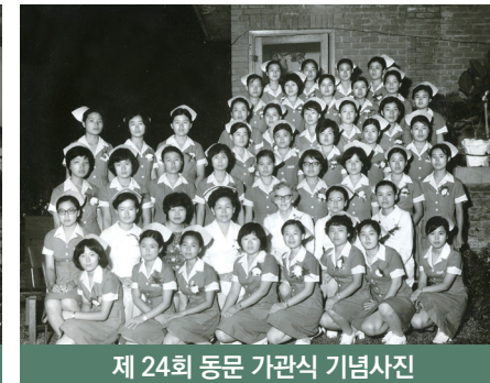
제 24회 동문 가관식 기념사진