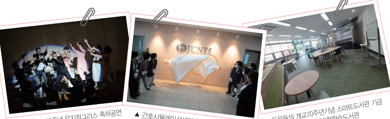
▲ 2020년 개교70주년 뮤지컬그리스 축하공연