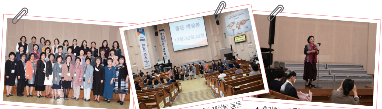
▲ 2020년 개교 70주년 기념 재상봉 동문

공연이 끝난 후에는 <간호시뮬레이션센터>와 <개방형 학습도서관> 헌판식이 있었다. 이날 행사에는 코로나19로 인해 많은 동문들이 함께 하지는 못하였으나, 참석한 동문들은 발전된 모교를 둘러보고 정성을 모은 발전기금을 총장에게 전달하였다.