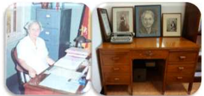
<생전 집무실에서의 모습과 현재 동문회실에 있는 교장님의 책상>