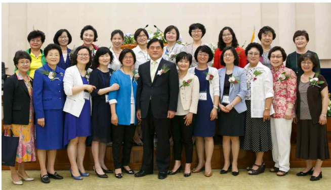
[2014년 재상봉동문: 11회, 36회]