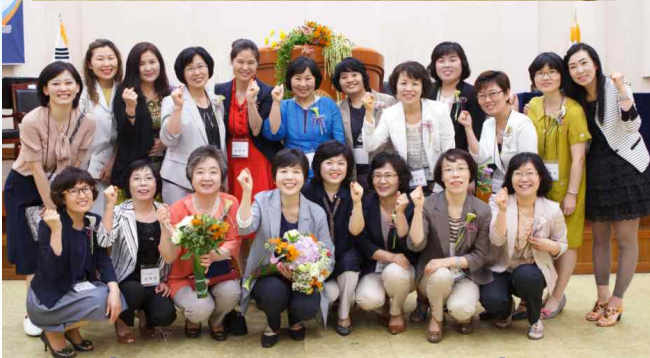
[2013년 재상봉동문: 제10회, 35회]