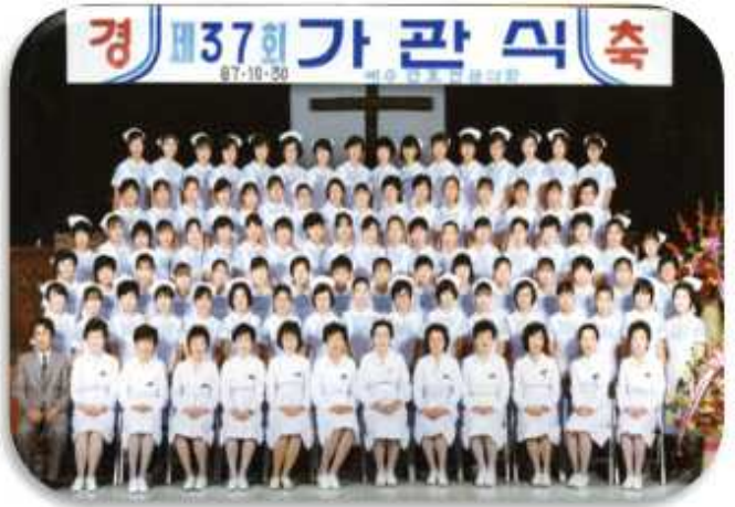
[제 37회] 동문 가관식 기념사진