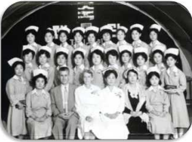
[제 12회] 동문 가관식 기념사진

발행일: 2014년 11월 11일 발행처: 예수대학교 총동문회 연락처: 063-230-7779, 230-7764