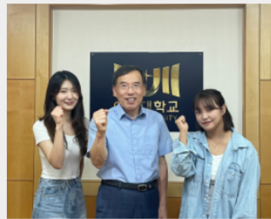
2024년 5월 총장님과 인터뷰 :)