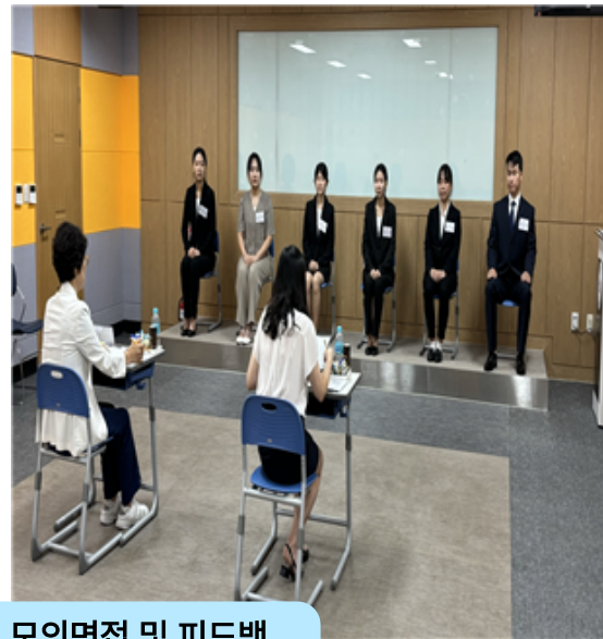
간호학부 소규모 실전 모의면접 및 피드백 13:00~16:00, 켈러홀 206호