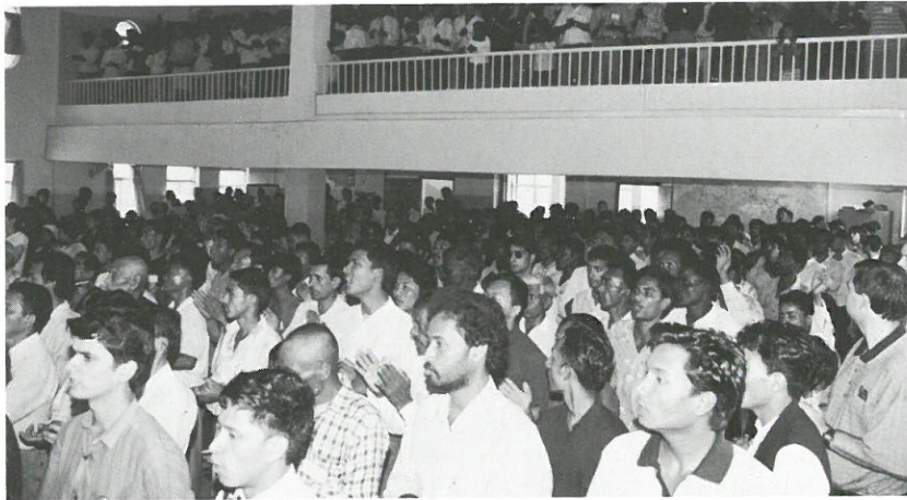
◀ 목회자들 훈련중 강의시간에