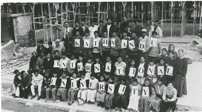
▲기독교 카투만두 인터내셔널 유니버시티 인가를 받은 후

나라 정부로 부터 인가받아 기독교 종합대학을 이루어 가게 하시며 또 남편의 공부를 마치게 하셨습니다.