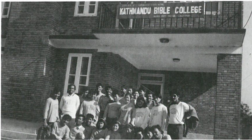
▲'91년도 처음 신학 대학을 시작한 건물과 학생들

나 자신의 안전과 평안을 위해 이 사역들을 이들과 함께 이루어 가기에는 제가 너무 이기주의였고 자아중심적이었습니다.