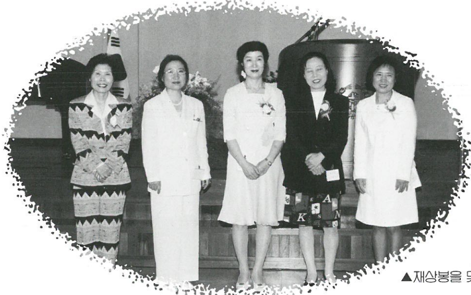
▲ 재상봉을 맞이한 21회 동문