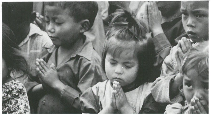
▲ '99년도 복음을 받은 귀한 영혼들(전도 여행때 잠수에서)