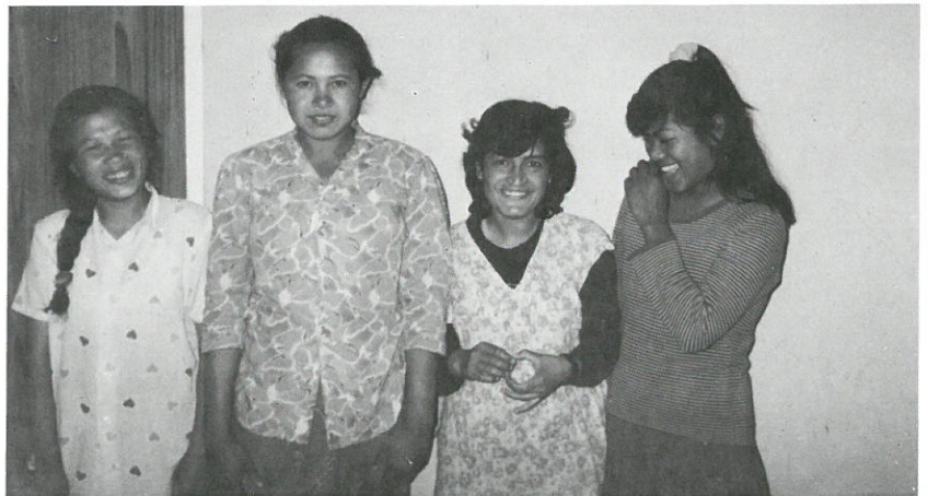
▶ '91년도 신학대학의 첫 여학생들