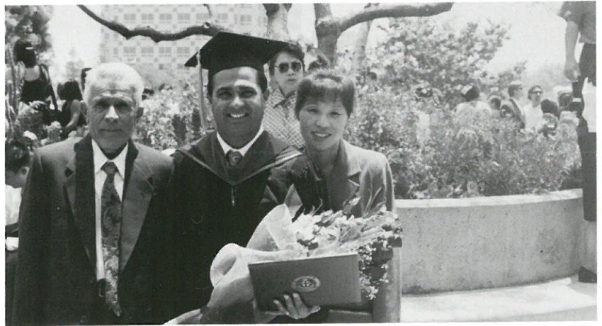
▶ 신학박사학위를 받은 남편 졸업식날 시아버님과 함께

'99년도는 Kathmandu International University를 이