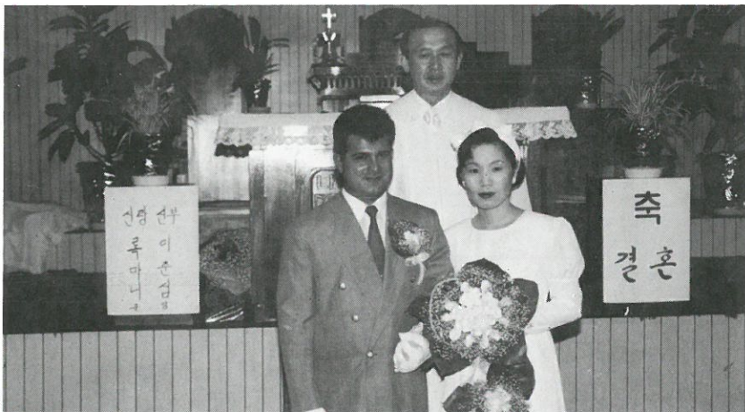
▲'92년 결혼식 전주 안디옥교회에서

님의 은혜의 바다에 던져져 수술을 받고 나의 한정된 남은 삶과 함께 네팔에 토해졌습니다. 그래도 환영해주는 믿음의 형제 반다리와 '92년 6월 결혼을했으나 오직 의지할 곳이라곤 보이지 않는 하나님 뿐!