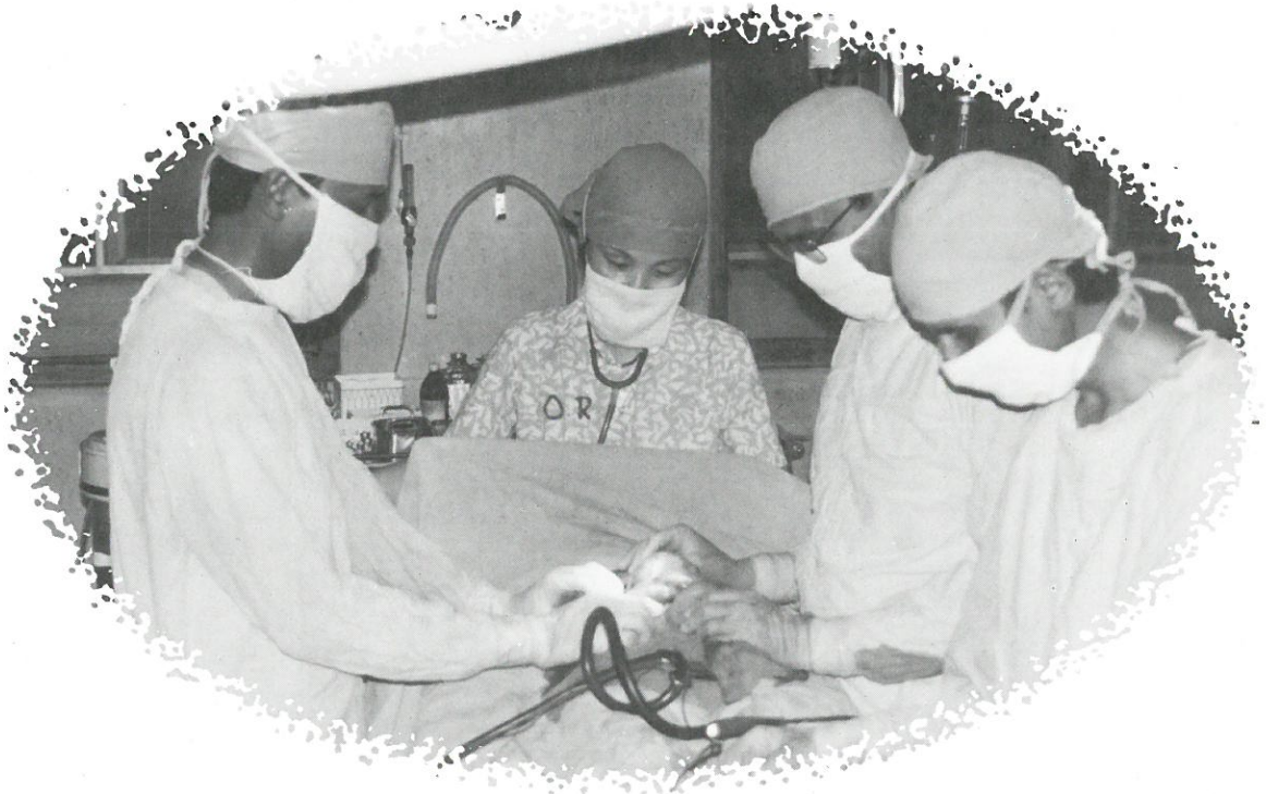
▲현지 의사들과 함께 수술하는 장면. 중앙에서 마취하고 있는게 필자입니다

그러나 너무도 큰 언어의 장벽은 내가 할 수 있는 최다의 단어를 구사하지만 복음을 전하기에는 그야말로 무능력! 저의 애타하는 한마디를 두마디, 세마디의 문장으로 연결시켜주시는 아버지의 은혜속에 환자들과 함께 기도하며 복음을 전하고자 노력하며 보낸 3년이었습니다.